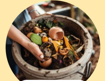
Récipient ou bioseau