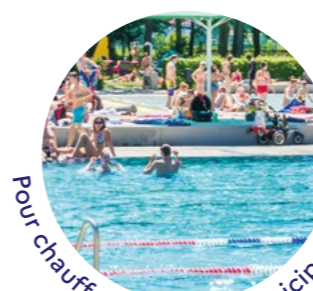
Pour chauffer la piscine municipale