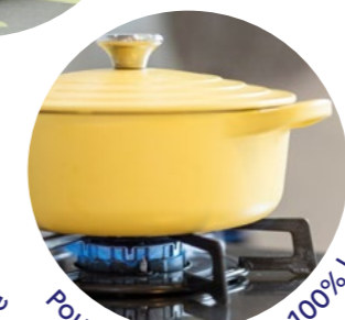
Pour un gaz de ville 100% local