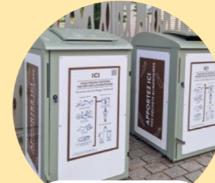
Point d'apport volontaire