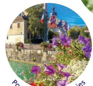
Pour des villes fleuries